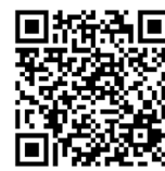
posts d'avertura DEP

Uffants sur 12 onns ston – sch'els han registrà ina nova MyTrustID persunala – passar persunalmain ensemen cun la represchentanza legala tar il post per l'avertura DEP e prender cun els lur telefonin (incl. agen numer da telefon ed adressa dad e-mail) e las cumprovas originalas numnadas sura.